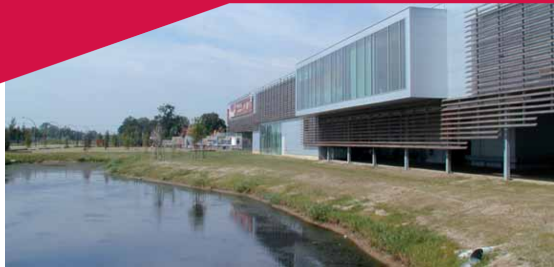
De zijde die grenst aan Bornebroek en De Doorbraak, deelgebied het Venster, kenmerkt zich door een terughoudende verschijningsvorm.

bedrijventerrein presenteren met een groot - XL dus - uitgevoerd object dat kenmerkend is voor hun bedrijf. Een element dat vergelijkbaar is met de schep die nu als herkenbaar element langs de snelweg staat.