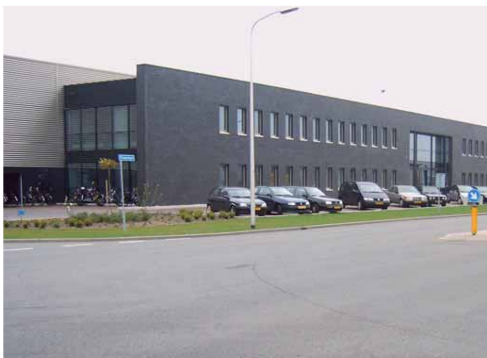
Bedrijven aan de zijde van de A35, deelgebied de Etalage, laten zien wat XL Businesspark Twente inhoudt: een grootschalig en hoogwaardig bedrijventerrein.

De Etalage is een deelgebied dat direct in het oog springt. Bedrijven in de Etalage bevinden zich op een zichtlocatie langs de snelweg. De kavels in dit gebied zijn bestemd voor de allergrootste ruimtevragers. Het thema 'XL' komt hier dan ook het meest nadrukkelijk naar voren. De bedrijven in de Etalage kunnen zich in de groenzone tussen de snelweg en het